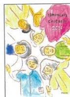
表紙 Yuji Abe「題名無し」/ 表紙題字 Atsushi